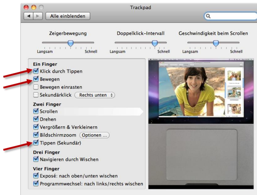
Abbildung 2: Konfigurieren des Trackpads (Screenshot aus Mac OS X Snow Leopard)

Nun können Sie das 3D Modell in Z88Aurora wie folgt bewegen: